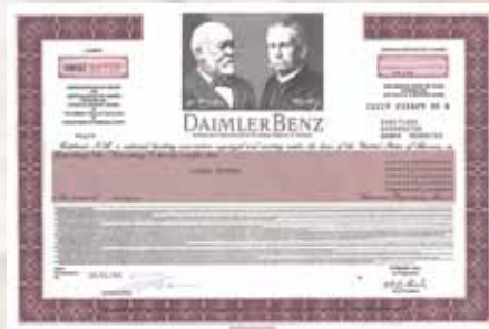
Daimler-Benz AG Aktie(American Deposit Share) 50 DM von 1993 Schätzwert 600,- Euro