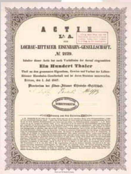
Loebau-Zittauer Eisenbahn-Gesellschaft Gründeraktie 100 Thaler von 1847 Schätzwert 1.500,- Euro

Selbstverständlich können sich am Bieten auf die Blind Dates auch Schriftbieter beteiligen! Sollte tatsächlich ein Schriftbieter der Höchstbieter bleiben, dann wird an seiner Stelle im Auktionssaal die jüngste anwesende Dame als Glücksfee die zu enthüllende Staffelei bestimmen.