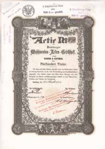
Duisburger Maschinenbau-AG vorm. Bechem & Keetman Gründeraktie 500 Thaler von 1872 Schätzwert 750,- Euro