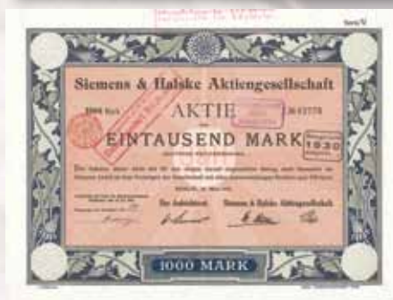
Siemens & Halske AG Berlin Aktie 1.000 Mark von 1919 Schätzwert 750,- Euro