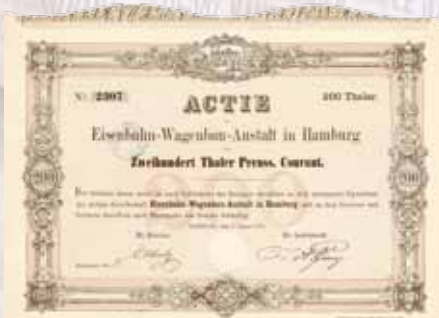
Eisenbahn-Wagenbau-Anstalt in Hamburg Gründeraktie 200 Thaler von 1871 Schätzwert 1.500,- Euro