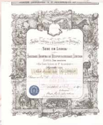
Jardim Zoologico e d'Acclimacao em Portugal Accao RS 20$000 von 1904 Schätzwert 500,- Euro